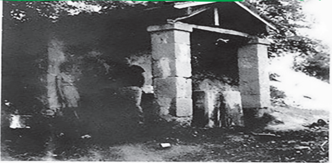
ROCCASALLI 1961 - FONTANA DEL COLLE